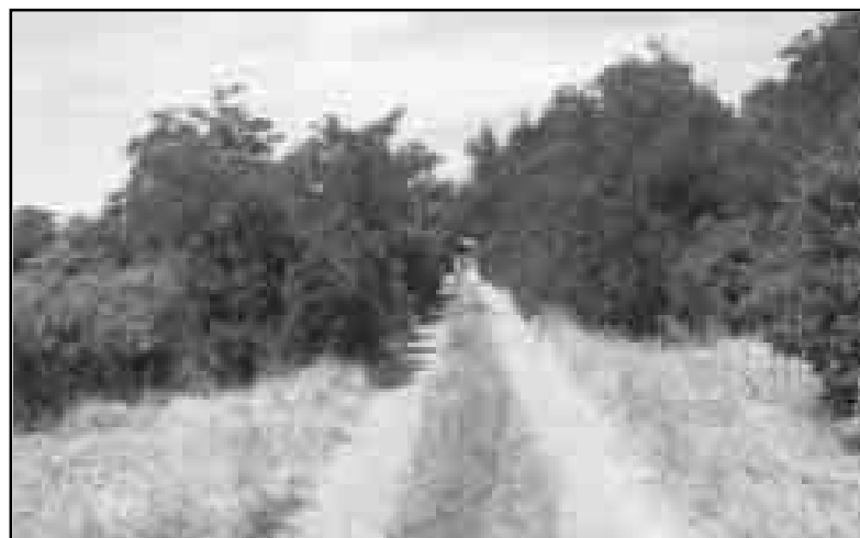
FOTOGRAFIA DE LOS JARDINES DEL PALACIO 12 de junio de 2003 Camino de entrada al palacio desde el portalón este, donde se aprecia el estado actual de abandono de los jardines y el peligro de incendio al que están expuestos.

“En los monumentos declarados Bienes de Interés Cultural no podrá realizarse obra interior o exterior que afecte directamente al inmueble o a cualquiera de sus partes integrantes o pertenencias sin autorización expresa